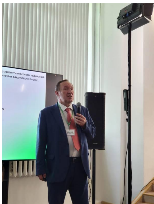
Выступление академика РАН В.М. Косолапова